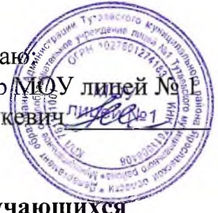
График организации горячего питания обучающихся